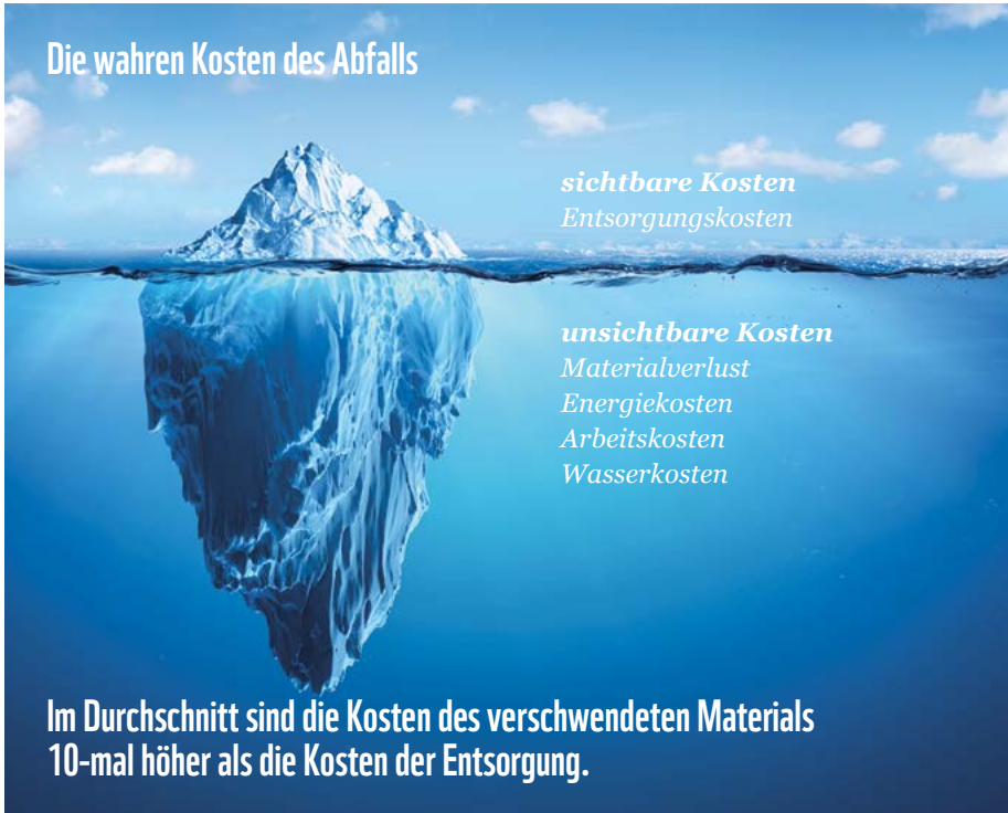
Abbildung 3: Kosten durch Lebensmittelabfälle

Der grundlegende erste Schritt ist es, Lebensmittelabfälle zu erfassen und die damit verbundenen Kosten in den Blick zu nehmen. Dennoch: Die Entsorgungskosten sind nur die Spitze des Eisbergs; weitere Ausgaben entstehen z. B. für die Energie bei der Lagerung, Produktion und Ausgabe sowie für das Personal bei der Zubereitung, Ausgabe und Entsorgung der Lebensmittel. Schätzungen gehen davon aus, dass die Gesamtkosten zehnmal höher liegen als die reinen Entsorgungskosten. 11